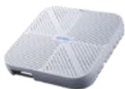
5G ORAN 企業專網設備