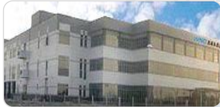
啓碁永昌通訊(昆山)