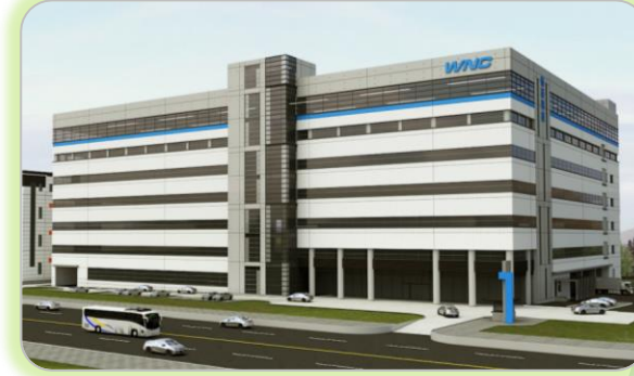
台南S3廠 Q1 2023啟用